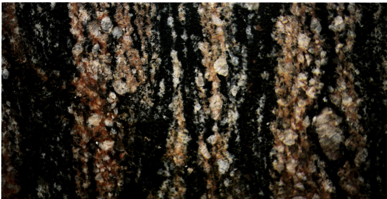
FIG. 110. – Campione 110 : GRANITO ROSSO ZONALE – Granito