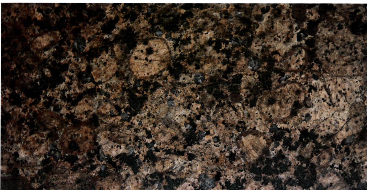
FIG. 111. – Campione 111 : GRANITO ROSSO ORBICOLARE – Granito