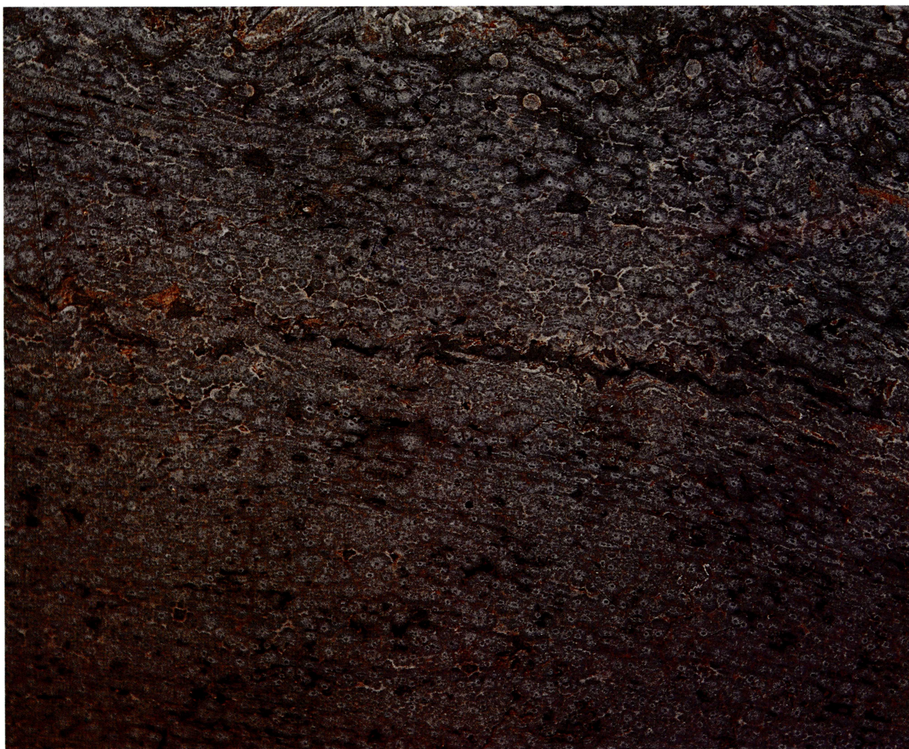
FIG. 222. – Campione 33: OSSIDIANA CENEROGNOLA – Ossidiana ( Lapis Obsianus )

« In genere vitri et obsiana numerantur ad similitudem lapidis quem in Aethiopia invenit Obsius, nigerrimi coloris, aliquando et translucidi, crassiore visu atque in speculis parietum pro imagine umbras reddente, gemmas multi ex eo faciunt, vidimus et solidas imagines divi Augusti capaci materia huius crassitudinis, dicavitque ipse pro miraculo in templo Concordiae obsianos quattuor elephantos ».