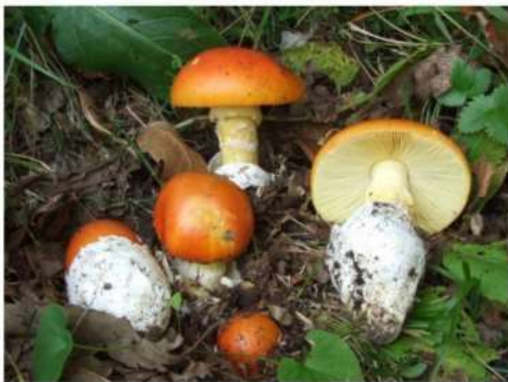
Amanita caesarea (Scop.) Pers.