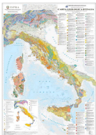
Figura 5 – L'ultima edizione della Carta Geologica d'Italia in scala 1:1.000.000, pubblicata dal Servizio Geologico d'Italia nel 2011 in occasione dei 150 anni dell'Unità d'Italia.