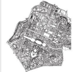
L'assistenza alla Prog. Servizio Parchi e Giardini avrà, Via Mingolla L'assistenza Servizio Parchi e Giardini Servizio Parchi e Giardini, il Responsabile sarà, via Roma, 100/100/100

Are verdi di proprietà di EUR SpA ed Are Verdi Capitale in manutenzione di EUR SpA per effetto di apposita convenzione