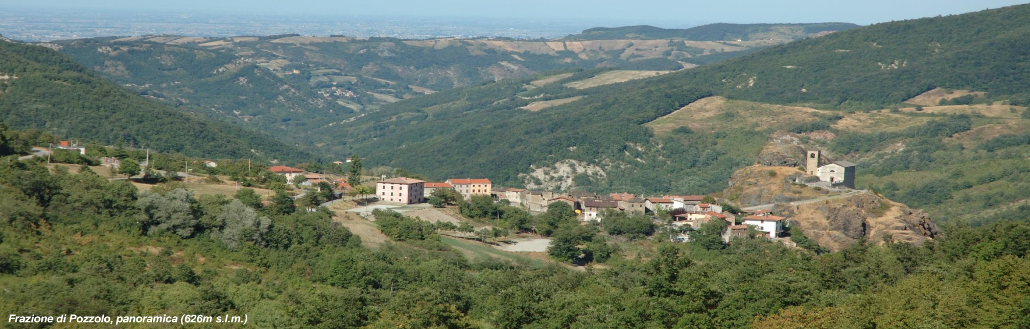
Frazione di Pozzolo, panoramica (626m s.l.m.)