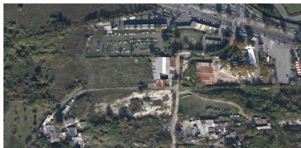
Roma, IV Municipio