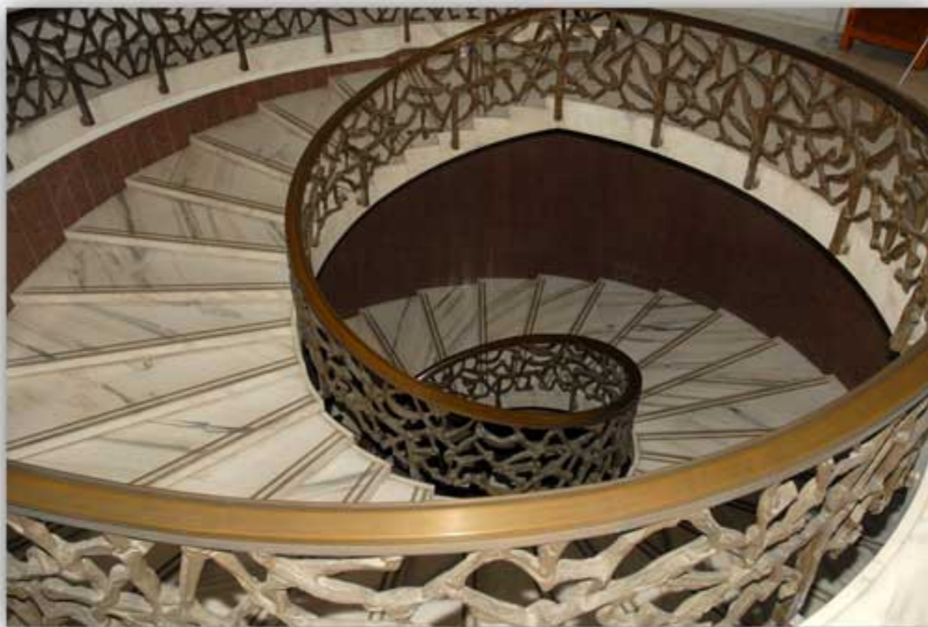
Palazzo della Federconsorzi - Via Curtatone 3 - Roma