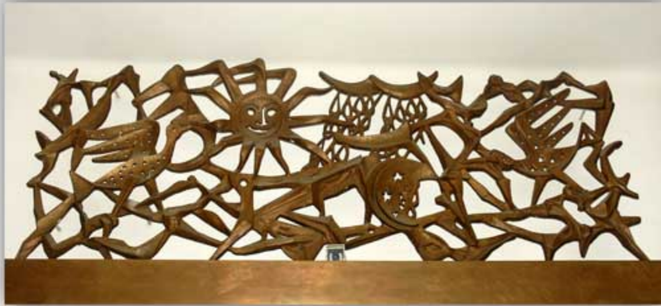
Palazzo della Federconsorzi - Via Curtatone 3 - Roma