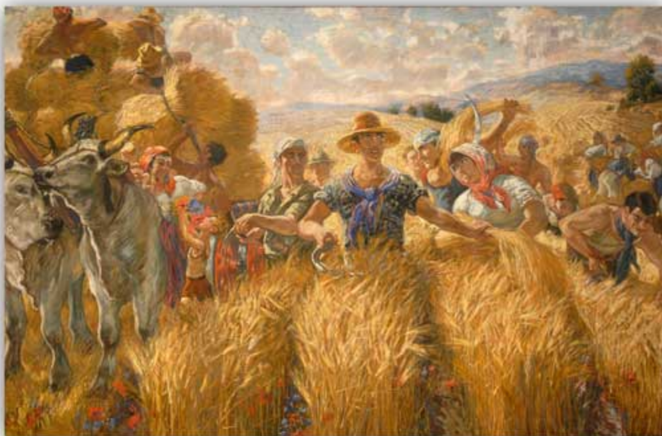
Palazzo della Federconsorzi - Via Curtatone 3 - Roma