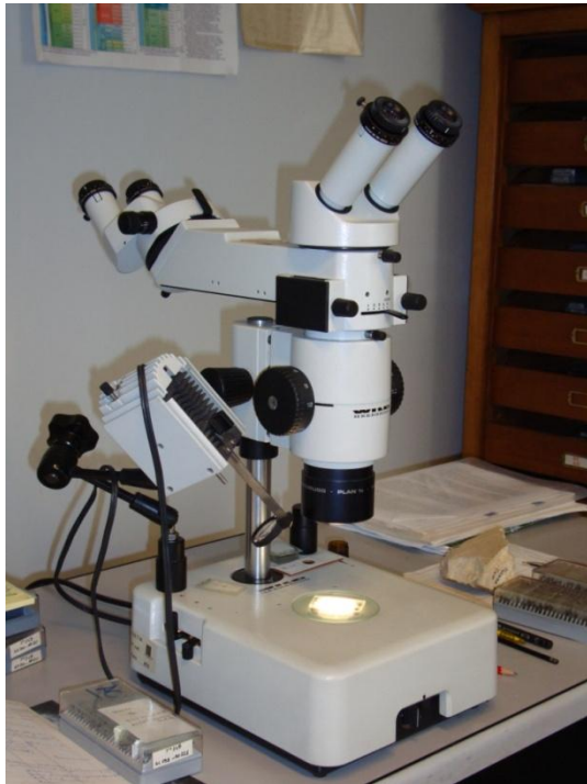
Microscopio ottico Wild M10