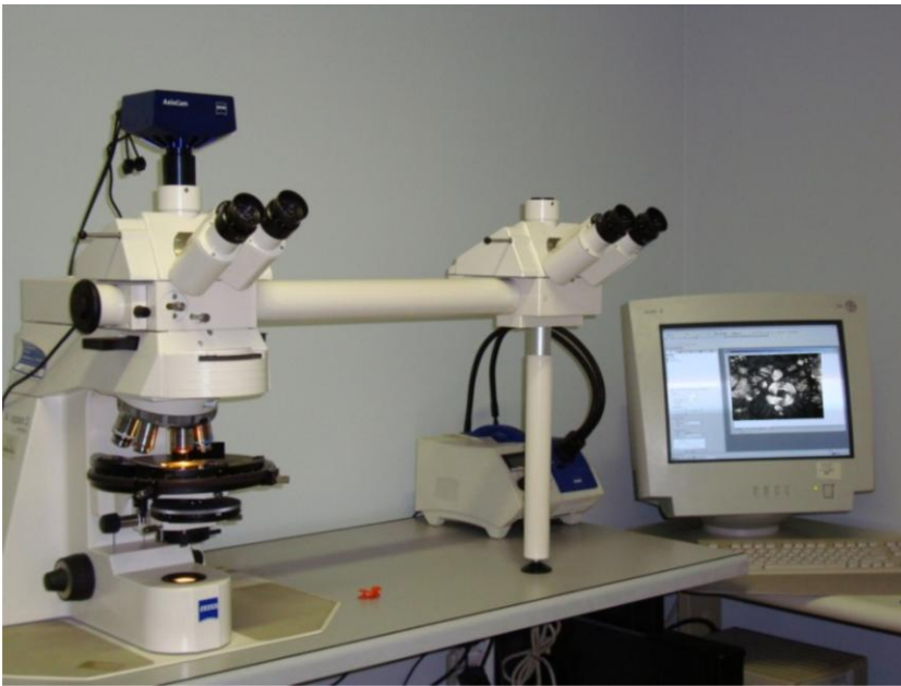
Microscopio ottico polarizzatore Zeiss con telecamera e monitor