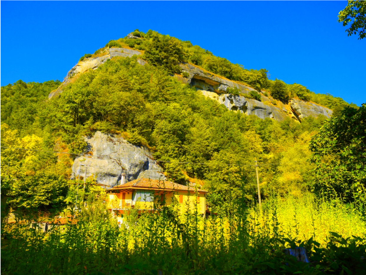
Figura 2 - Panoramica del tratto interessato dal rilevamento. Si notano blocchi aggettanti di rilevanti dimensioni

Sarebbe opportuno eseguire uno studio di stabilità di dettaglio sull’intero tratto al fine di valutare con esattezza i luoghi a maggiore pericolosità ed integrare o migliorare le misure di protezione eventualmente già esistenti.