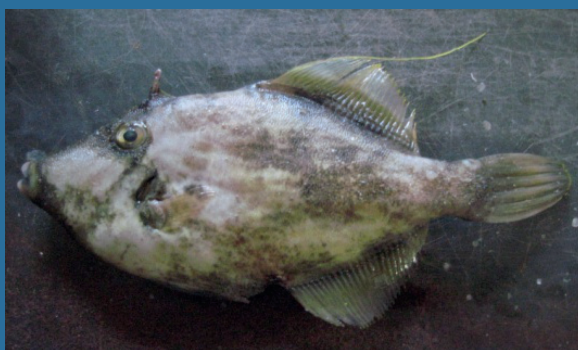
Stephanolepis diaspros