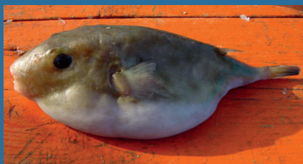
Spherooides pachygaster