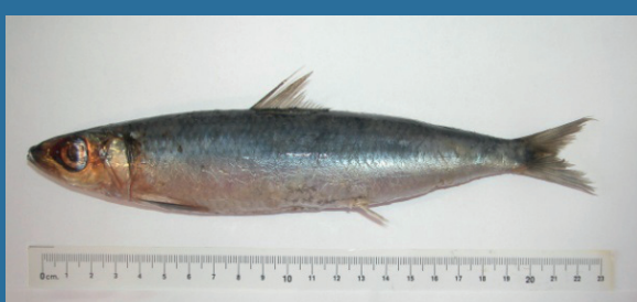
Etrumeus teres