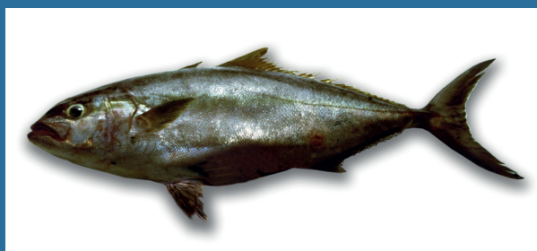
Seriola carpenteri

IN CASO DI CATTURA DI UNA DELLE SPECIE SOTTOSTANTI O COMUNQUE DI UNA SPECIE NON CONOSCIUTA SI PREGA DI FOTOGRAFLARLA E SUCCESSIVAMENTE CONGELARLA, CONTATTANDO POI: alien@isprambiente.it oppure 0916114044