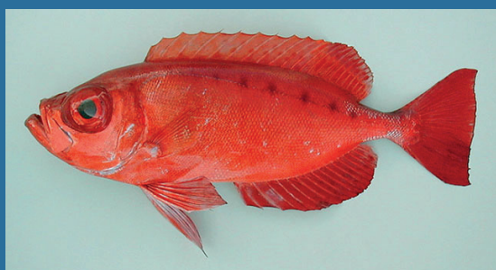
Priacanthus arenatus