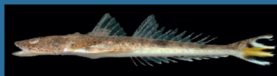
Platycephalus indicus