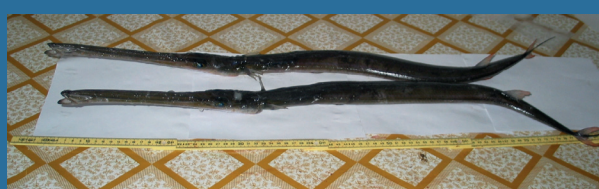
Fistularia commersonii