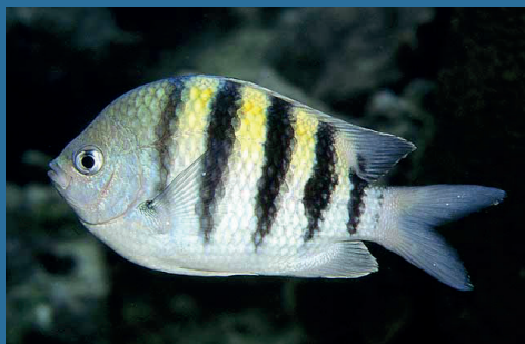
Abudefduf saxatilis