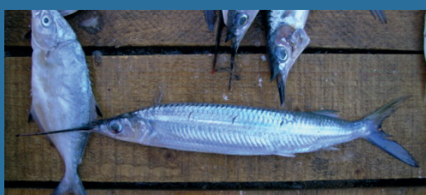
Hemiramphus far