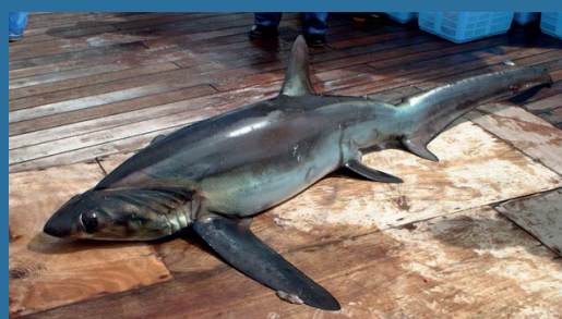
Alopias superciliosus