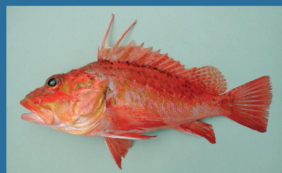
Pontinus kuhlii