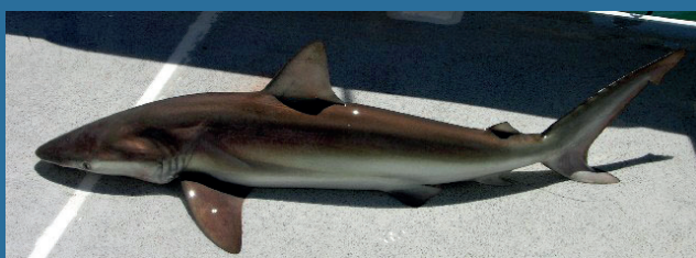
Carcharhinus brachyurus