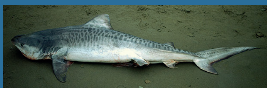
Galeocerdo cuvier