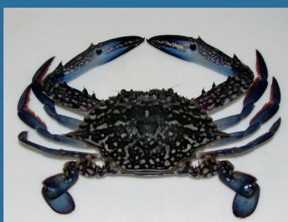
Portunus pelagicus