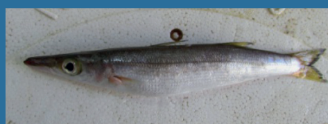
Sphyrna pinguis