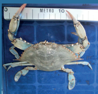
Callinectes sapidus