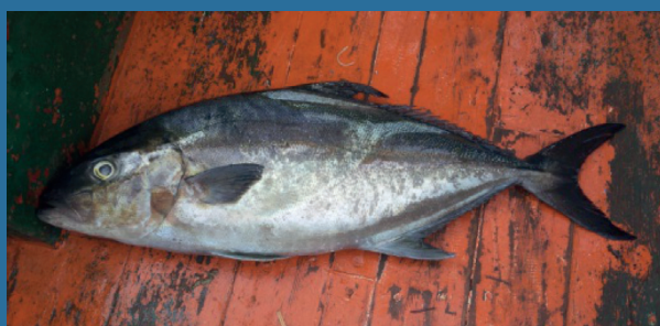
Seriola rivoliana