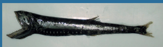
Gonostoma elongatum