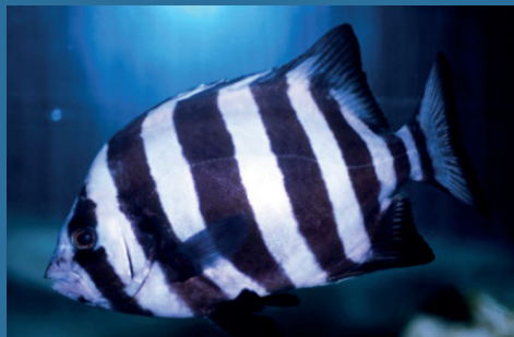
Oplegnathus fasciatus

IN CASO DI CATTURA DI UNA DELLE SPECIE SOTTOSTANTI O COMUNQUE DI UNA SPECIE NON CONOSCIUTA SI PREGA DI FOTOGRAFLARLA E SUCCESSIVAMENTE CONGELARLA, CONTATTANDO POI: alien@isprambiente.it oppure 0916114044