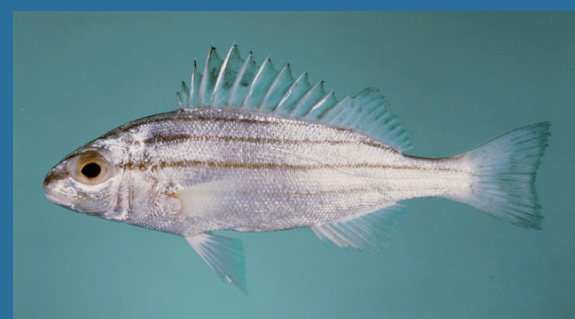
Pelates quadrilineatus