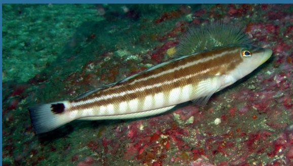
Pinguipes brasilianus