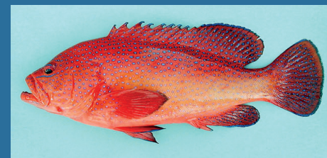
Cephalopholis taeniops