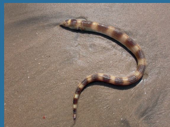
Pisodonophis semicinctus