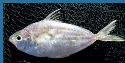
Equulites klunzingeri