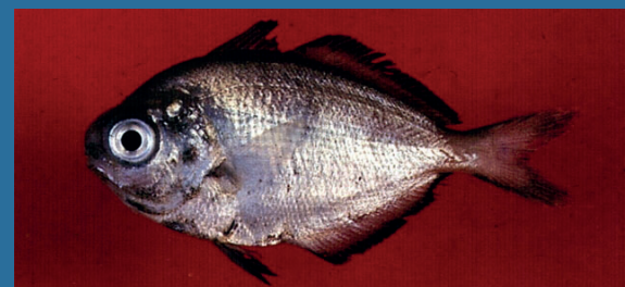
Psenes pellucidus