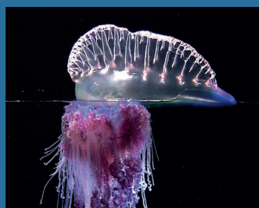
Physalia physalis ⚠️