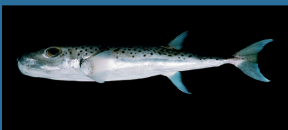
Lagocephalus scleratus