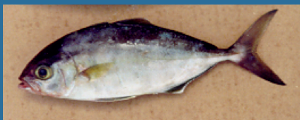
Seriola fasciata