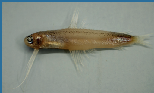
Bregmaceros atlanticus