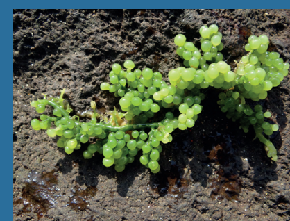
Caulerpa cylindracea