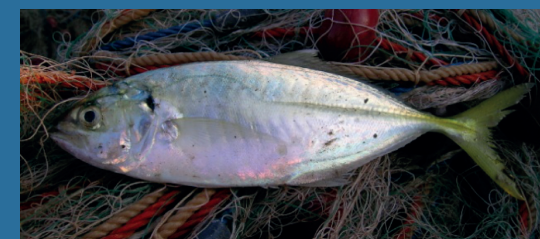
Alepes djedaba