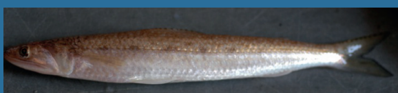
Saurida undosquamis