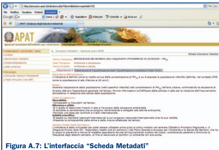
Figura A.7: L'interfaccia "Scheda Metadati"

L'esito della ricerca è una lista di indicatori con i requisiti specificati in precedenza dall'utente. Per ogni indicatore può essere visualizzata la relativa scheda metadati e dati (Figure A.7 e A.8).