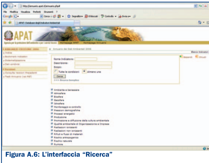
Figura A.6: L'interfaccia "Ricerca"

L'esito della ricerca è una lista di indicatori con i requisiti specificati in precedenza dall'utente. Per ogni indicatore può essere visualizzata la relativa scheda metadati e dati (Figure A.7 e A.8).