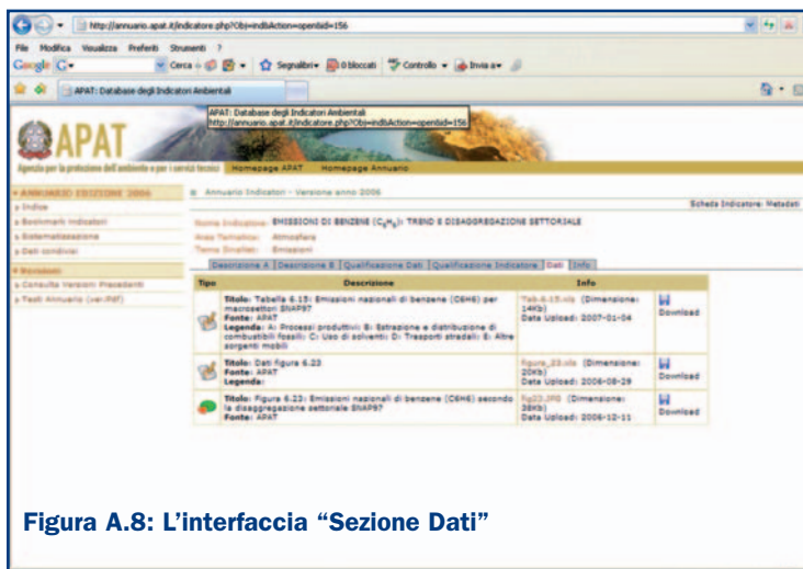
Figura A.8: L'interfaccia "Sezione Dati"

Gli indicatori possono essere selezionati tramite la funzione "Aggiungi a Bookmark" che consente la creazione di un report (in versione Pdf o Html) avente la struttura e le stesse informazioni presenti nelle schede indicatore dell'Annuario.