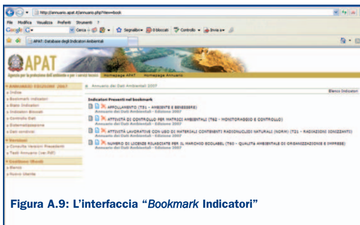
Figura A.9: L'interfaccia "Bookmark Indicatori"

Gli indicatori possono essere selezionati tramite la funzione "Aggiungi a Bookmark" che consente la creazione di un report (in versione Pdf o Html) avente la struttura e le stesse informazioni presenti nelle schede indicatore dell'Annuario.