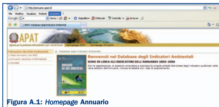
Figura A.1: Homepage Annuario

La figura A.1 mostra l' homepage dell'applicazione.