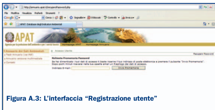
Figura A.3: L'interfaccia “Registrazione utente”

La Figura A.4 mostra la pagina iniziale che l'utente base raggiunge dopo il login .