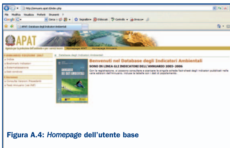
Figura A.4: Homepage dell'utente base

La Figura A.4 mostra la pagina iniziale che l'utente base raggiunge dopo il login .