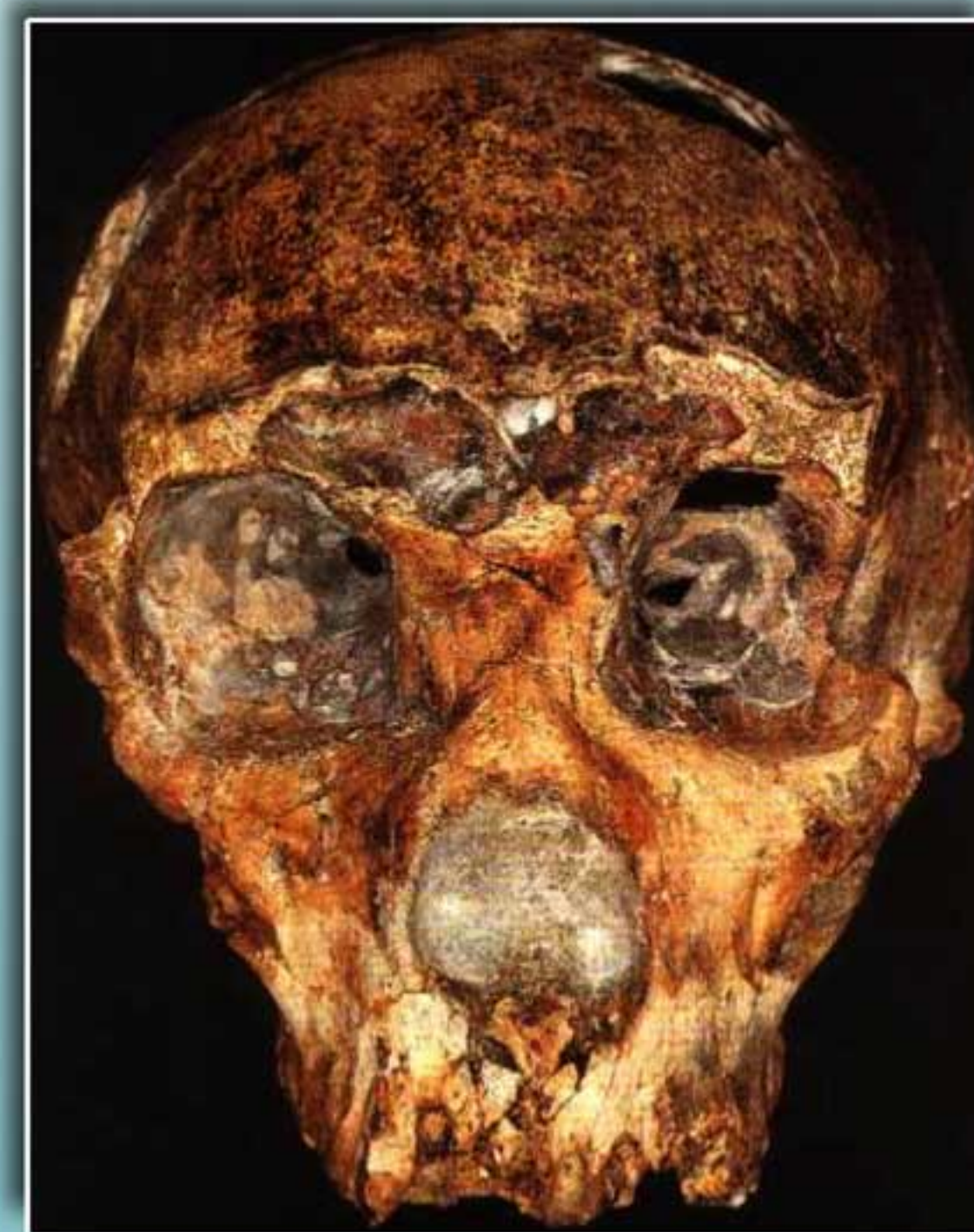
Reperto originale "Saccopastore I"