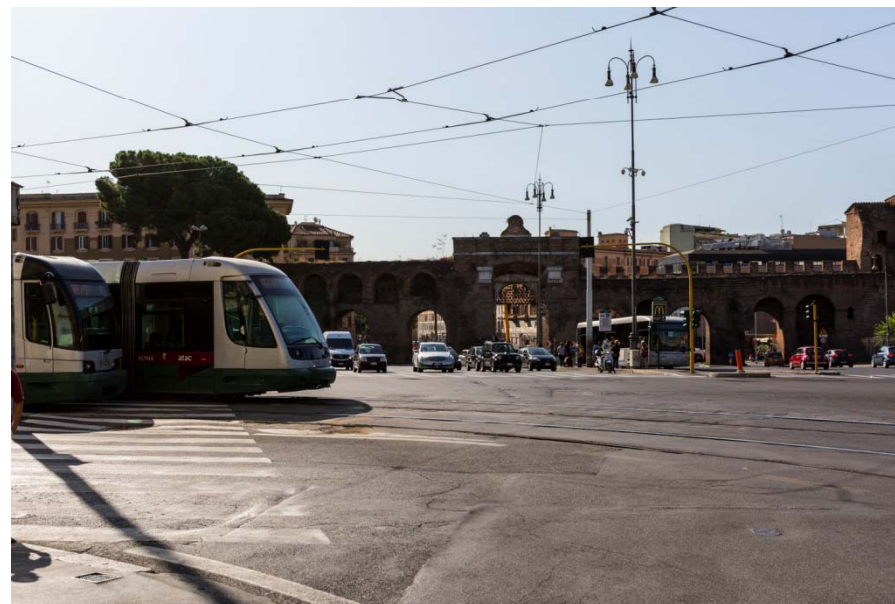
Fotografie del sistema dei trasporti urbani della Città di Roma nel passato e al tempo di oggi