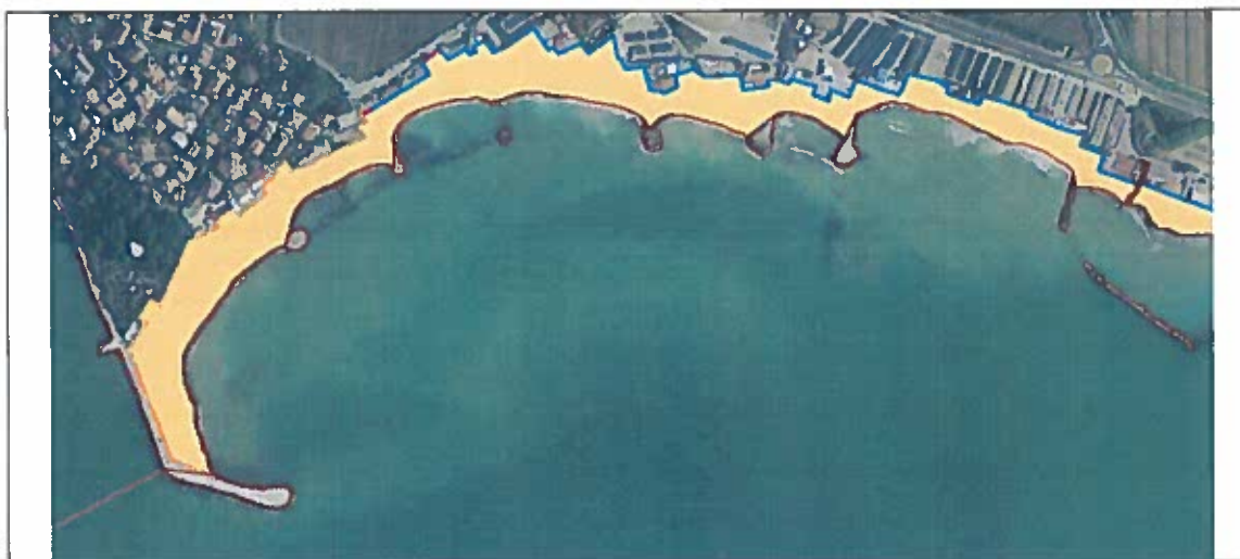
Figura. 4 Delimitazione di spiagge: poligono compreso tra linea di riva e di retrospiaggia.

La linea di riva e il limite interno della costa delimitano le spiagge emerse, esempio in Figura 4. Dalla mappa vettoriale delle spiagge occorre ricavare con funzioni di analisi spaziale alcuni parametri dimensionali, quali superficie, perimetro, lunghezza e ampiezza media e massima dei litorali italiani, secondo i quali classificare le spiagge identificate.