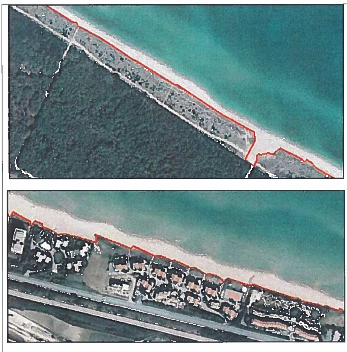
Figura 2 Esempi di digitalizzazione del limite di retrospiaggia (Molise)

Nelle immagini a colori il limite interno dei litorali è particolarmente evidenziato dalla presenza di vegetazione, dall'ubicazione di manufatti e infrastrutture viarie, da variazioni geomorfologiche oltre le quali il territorio assume nuove e diverse caratteristiche geologiche e ambientali. In Figura 2 sono riportati due esempi di delimitazione da ortofoto a colori.