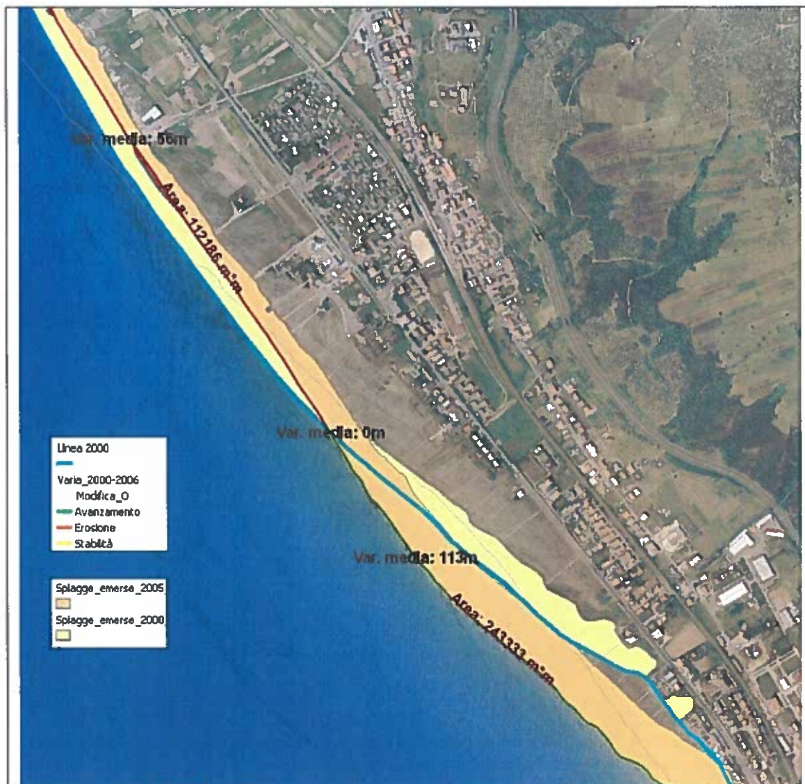
Figura 6. Rilevazione delle variazioni geomorfologiche mediante sovrapposizione dell'assetto delle linee di riva e delle spiagge: a nord arretramento medio di 56 m e 112.186m 2 di superficie erosa, a sud avanzamento medio di 113 m e 243.333m 2 di superficie in progradazione. (Calabria)