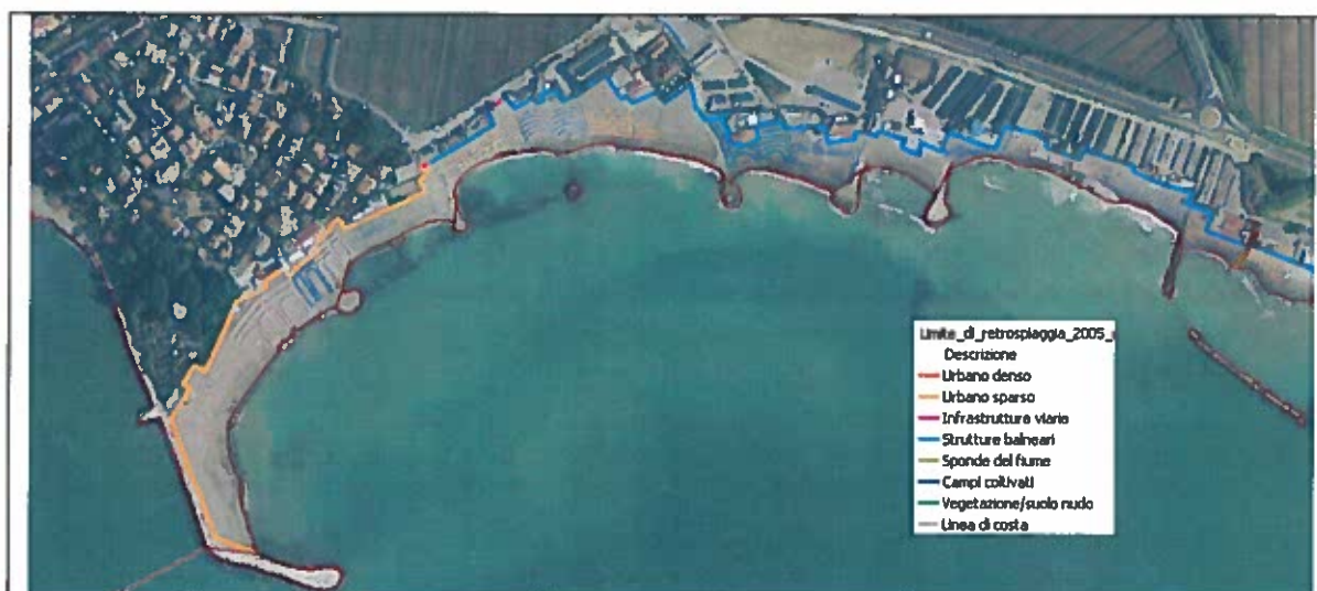
Figura 3. Esempio di classificazione del limite di retrospiaggia (Toscana)