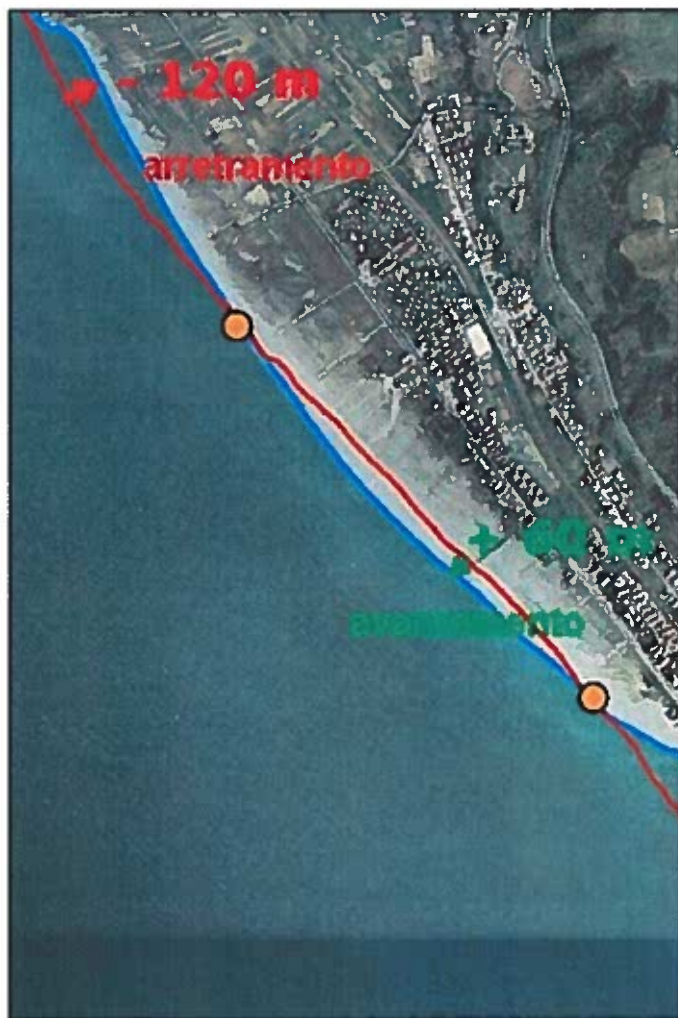
Figura 5. Esempio di rilevazione delle modifiche, con indicazione del tipo e del valore massimo della variazione. In rosso la "Linea di riva 2000" e in azzurro la "Linea di riva 2006" su ortofoto del volo IT2006. (Calabria)

Le variazioni morfologiche rilevate devono essere documentate mediante mappe cartografiche dei tratti di costa e delle superfici in erosione, in avanzamento e stabili, unitamente a riferimenti amministrativi e territoriali.