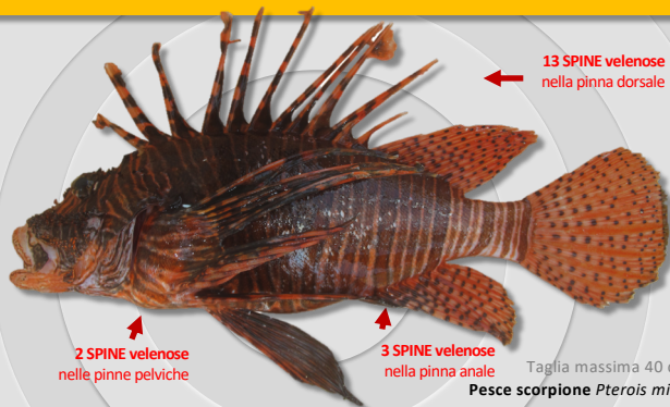
13 SPINE velenose nella pinna dorsale

Entrato dal Canale di Suez, il pesce scorpione è stato segnalato per la prima volta in Italia nel 2016 ed è una tra le specie più invasive al mondo. La specie è commestibile ma bisogna fare attenzione alle spine, queste possono causare punture molto dolorose anche dopo la morte dell'animale.