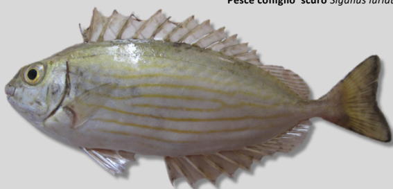
Taglia massima 27 cm