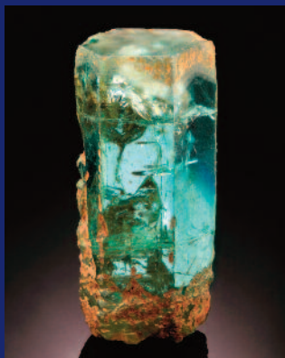
Berillo - Museo di Mineralogia

La Notte Europea dei Musei si avvicina: il 19 maggio si apriranno straordinariamente e gratuitamente in orario serale e notturno le porte di musei ed aree archeologiche di tutta Europa. L'evento, con il patrocinio dell'Unesco e del Consiglio d'Europa, è nato in Francia nel 2005. I luoghi della "maratona" culturale notturna saranno ani-