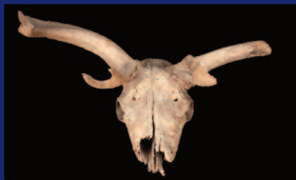
Alce d'Irlanda - Museo di Paleontologia

Perché nell'ambito di questo importante evento culturale i tre Musei di Scienze della Terra dell'Università di Roma "La Sapienza", insieme agli altri Musei del Polo Museale Sapienza, presenteranno un ricco programma culturale, ludico e didattico per adulti e bambini, che si aggiungerà alla possibilità di visitare gratuitamente le straordinarie collezioni!