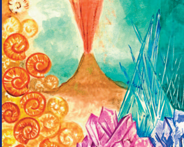
disegno di Georgia Cametti