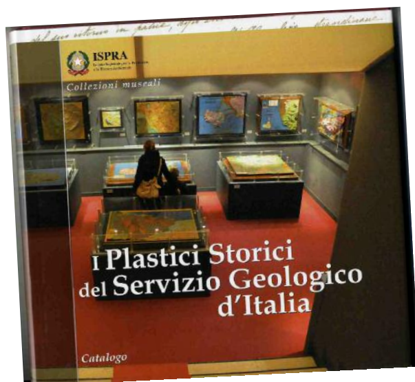
Copertina della monografia "I plastici storici del Servizio Geologico d'Italia" (Catalogo, Collezioni Museali, ISPRa 2012).

La produzione di piani-rilievo è continuata, nel corso del '900, anche se in modo più occasionale, soprattutto per la didattica (alcuni perfino realizzati come prova d'esame dagli stessi studenti di geologia).