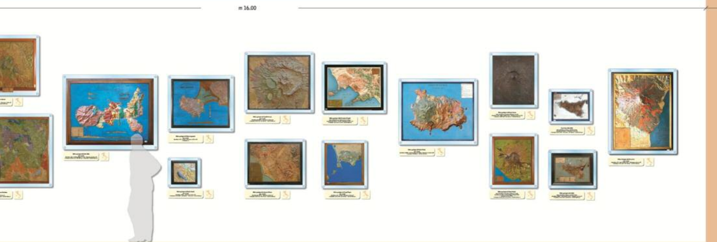
Progetto allestimento Collezione piani-rilievo dell'ISPRA (a cura di S. Fulloni e P. Moretti)