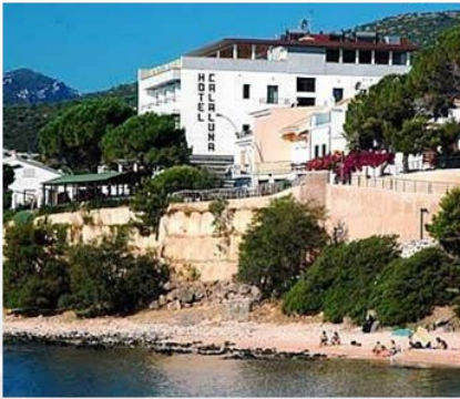
Hotel Cala Luna Via Palmasera, 6 08022 Cala Gonone Dorgali (NU)

Il Comitato per l'Ecolabel e per l'Ecoaudit — Sezione ECOLABEL ha deliberato la concessione del marchio Ecolabel UE alle seguenti strutture ricettive: