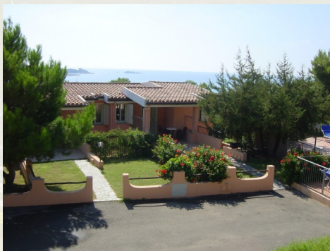
Residence La Chimera Località Campulongu snc 09049 Villasimius (CA)