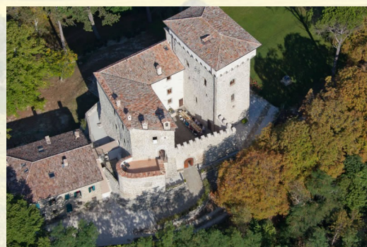
Agriturismo Castello di Magrano Frazione Carbonesca 06020 Gubbio (PG)