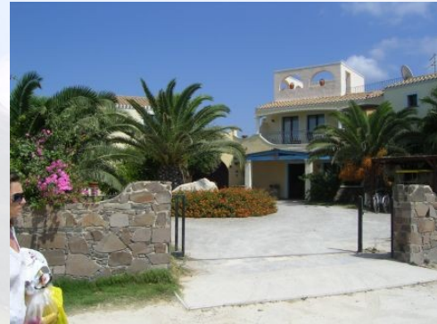
Hotel Luci del Faro Località Mangiabarche 09011 Calasetta (CI)