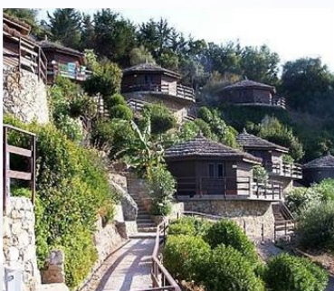
Calanica Residence Hotel Contrada Vallone di Falco Cefalù Palermo

Il Comitato per l'Ecolabel e per l'Ecoaudit — Sezione ECOLABEL ha deliberato la concessione del marchio Ecolabel UE alle seguenti strutture ricettive: