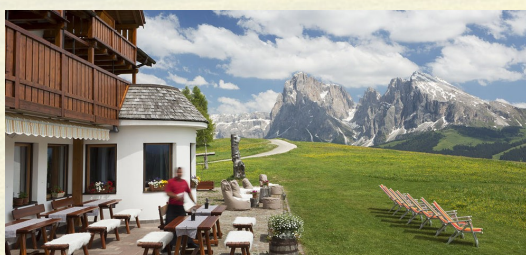
Hotel Gasthof Icaro Piz 18/1 Alpe di Siusi / Castelrotto Bolzano