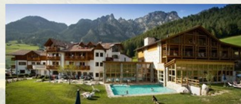
Hotel Cyprianerhof Via S. Cipriano, 69 Tires Bolzano