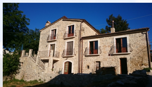
Affittacamere Majella.me Contrada Decontra Caramanico Terme Pescara