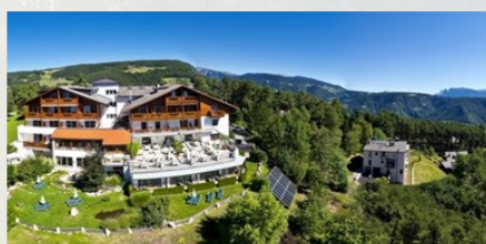
Hotel Schonblick Belvedere Pichl 15 San Genesio Bolzano