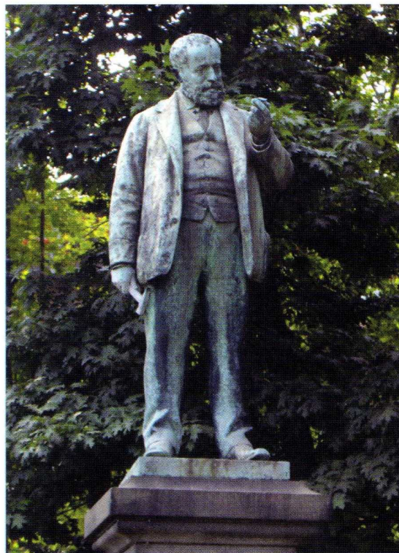
Fig. 1 Quintino Sella bronze monument, in Turin, realized by Cesare Reduzzi in 1893.