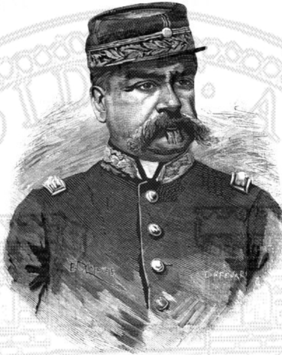
IL GENERALE DON BENIAMINO VICTORICA.

Oltre a ciò, i feroci figli dei boschi delle contrade del Chaco, quei che sacrificarono l'illustre dottore Crevaux , il quale fu vittima della loro ferocia, e la cui immatura morte non sarà mai abbastanza compianta, o si sono ritirati ai confini limitrofi alla Bolivia o si sottomisero alle valorose truppe comandate dal Generale Victorica, attuale