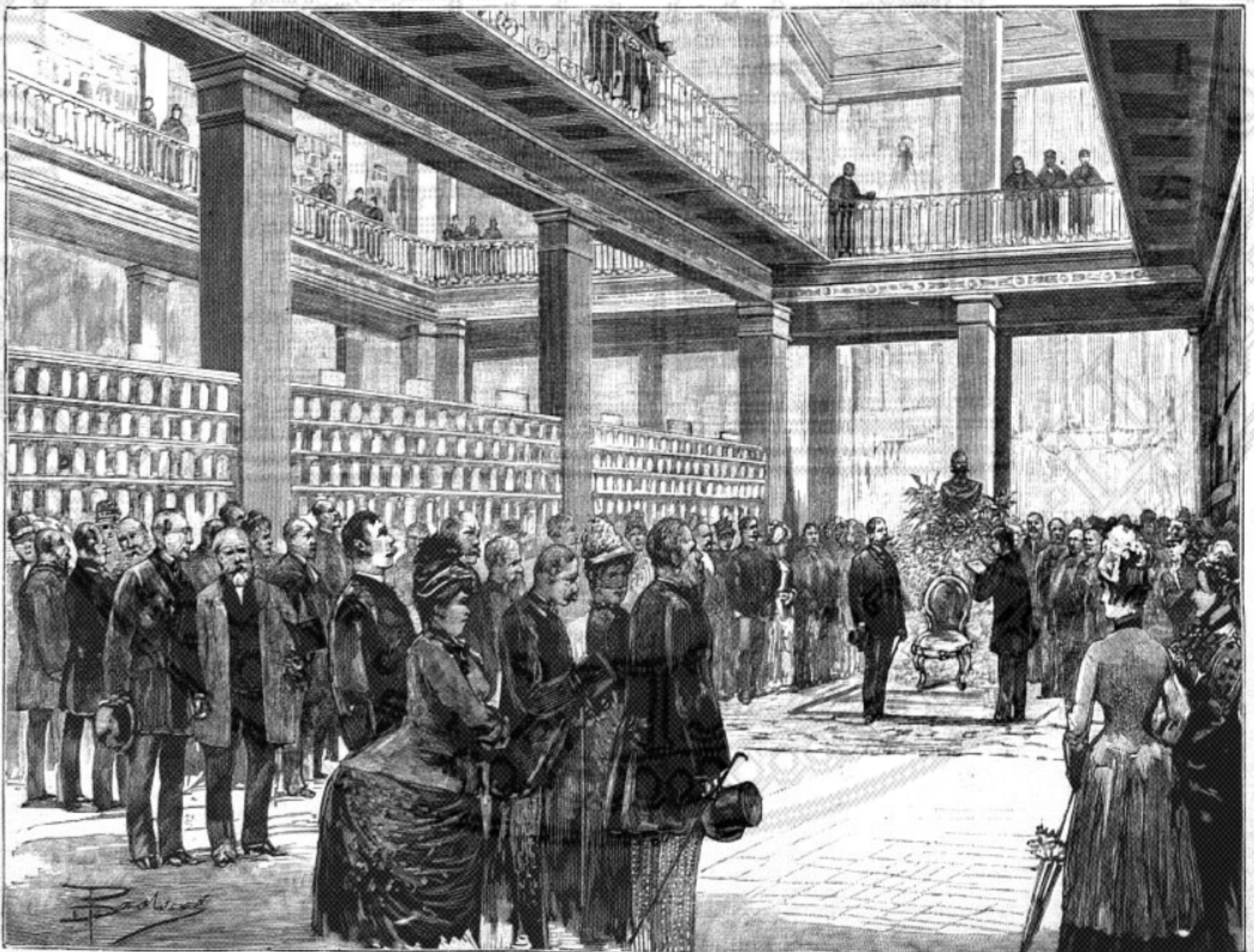
Roma. — SUA MAESTÀ IL RE INAUGURA IL MUSEO AGRARIO (disegno dal vero di Dante Paolucci). [Vedi pag. 325].