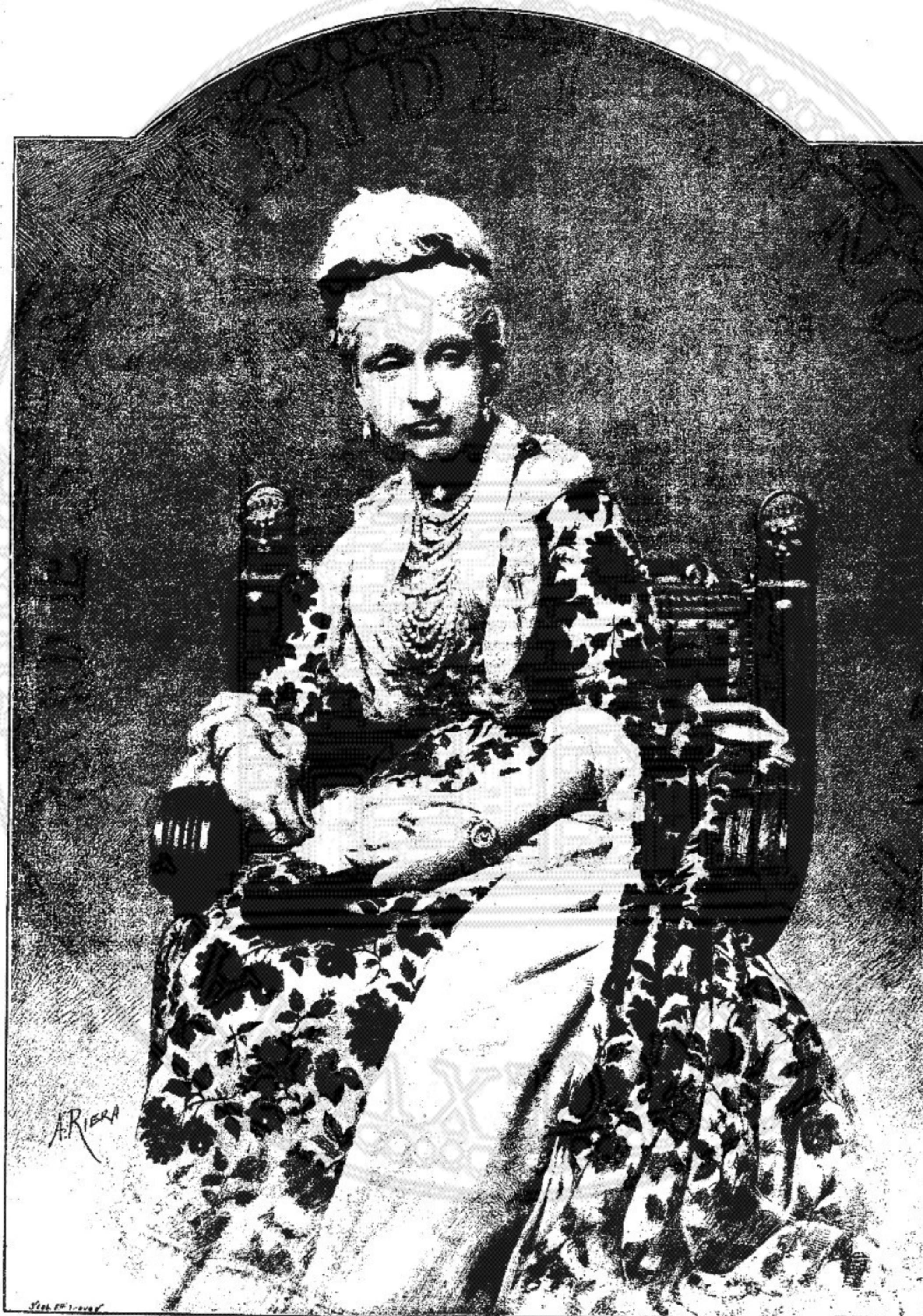
S. A. R. LA DUCHESSA DI GENOVA, MADRE DELLA REGINA (ultimo disegno del fu A. Riera, da una fotografia di M. Schemboche di Torino).