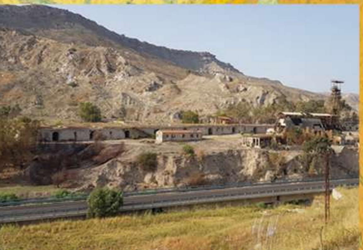
Miniera Trabia (Sommatino)