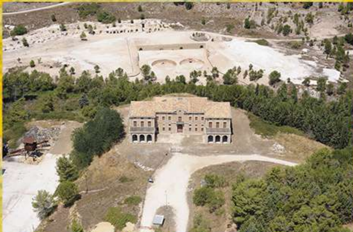
Parco Minerario Floristella-Grottacalda visto dall'alto