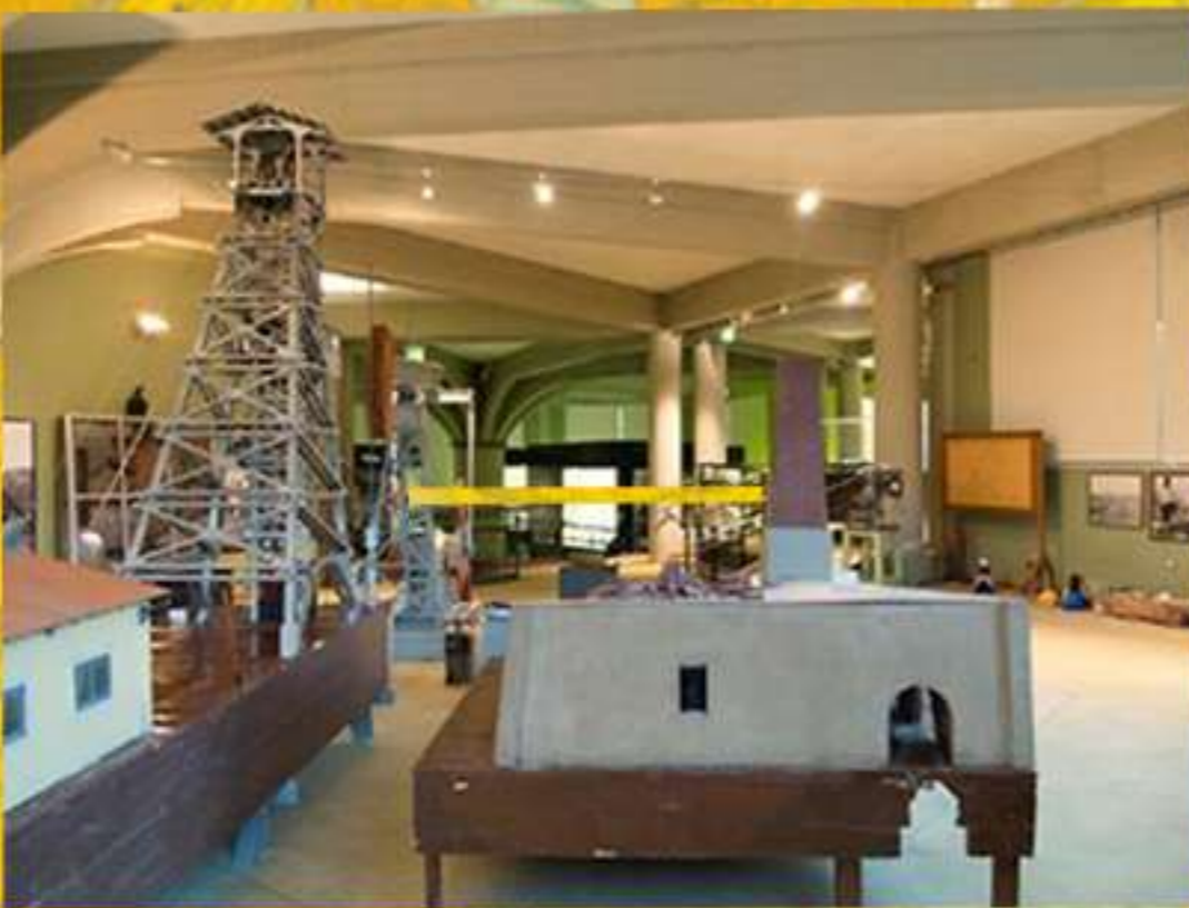
Interno del museo Mineralogico, Paleontologico e della Zolfara (ex istituto minerario "S. Mottura")