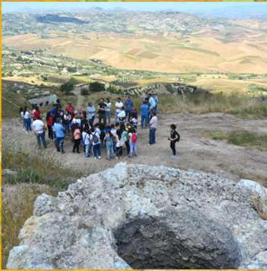
Parco minerario delle zolfare di Comitini con discenderie e forni gill