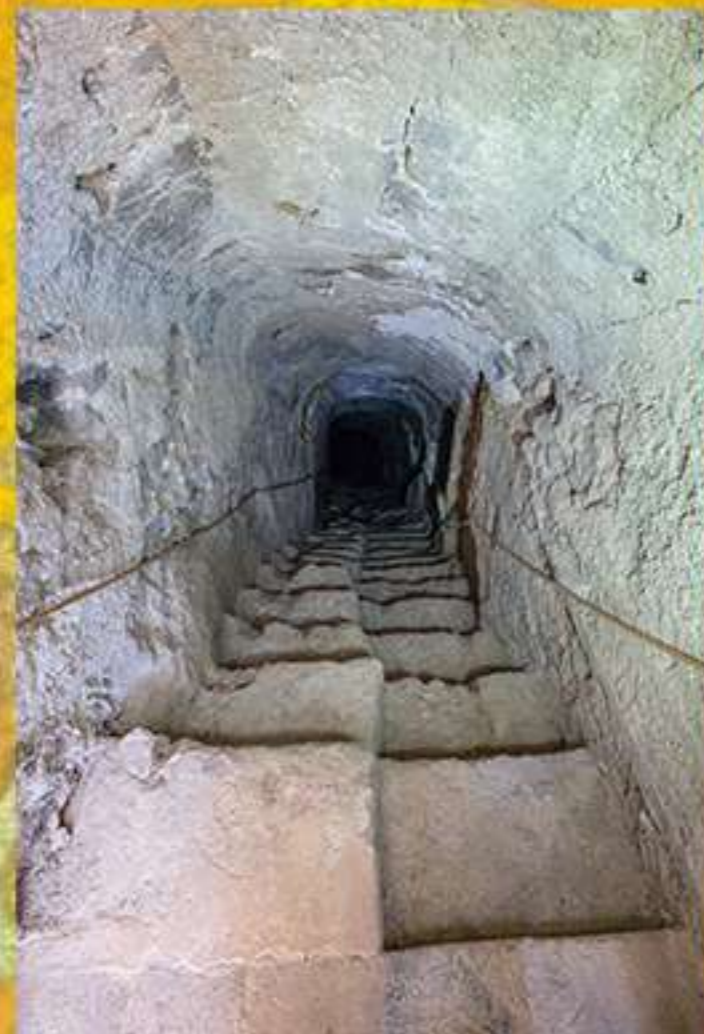
Solfara Persico, discenderia S.Michele a gradino rotto (Parco Minerario Gabara)