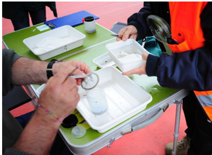
Figura 2B – Raccolta dei campioni da trasferire in laboratorio

Al termine di tutte le identificazione e conteggio ogni EP ha il compito di raccogliere gli individui contenuti nelle 4 vaschette che sono assegnate al suo tavolo e di fissarli con etanolo a 70 % (Figura 2B).