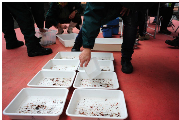
Figura 1B – Preparazione dei campioni: riempimento delle vaschette grandi con il campione omogeneizzato utilizzando una piccola vaschetta dosatrice.