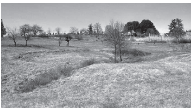
Fig. 4 - Dolina di collasso di circa 70 m di diametro impostata al contatto tra il Membro siltoso-argilloso delle Argille Azzurre e il CTV, fra gli abitati di Coconato e Montiglio. (FIORASO et alii , 2004). - Collapse doline of 70 m diameter set up in contact between silt-clay member of Blue clay formation and CTV, placed between Coconato and Montiglio (FIORASO et alii, 2004).

Ciò nonostante ad oggi il rischio da sinkhole nel Basso Monferrato non è completamente definito ed in particolare non è considerato in modo specifico nei programmi di previsione e prevenzione predisposti dalle autorità competenti. Da una prima analisi dei dati reperiti nella presente ricerca il rischio sembra circoscritto a limitate porzioni del territorio del Basso Monferrato, dove si trovano cave sotterranee attive o inattive, i segnali riscontrati permettono di ipotizzare un livello di rischio medio. I fattori di rischio riscontrati sono differenti e distribuiti in modo eterogeneo nel territorio per-