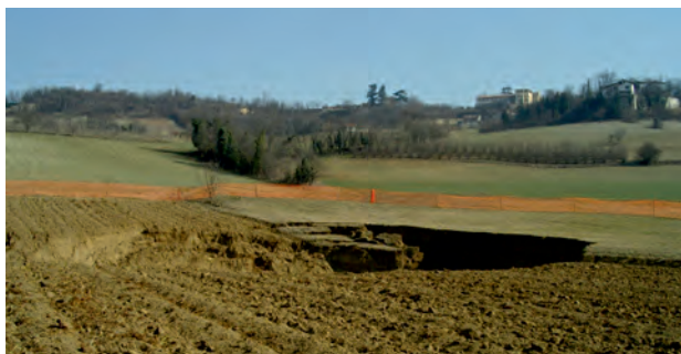
Fig. 5 - Sinkhole di Moncalvo. - Moncalvo Sinkhole.

DEL 18.11.2011). Dagli atti non risulta ancora essere stata esplicitata una metodologia per procedere nell'attuazione di questi programmi.