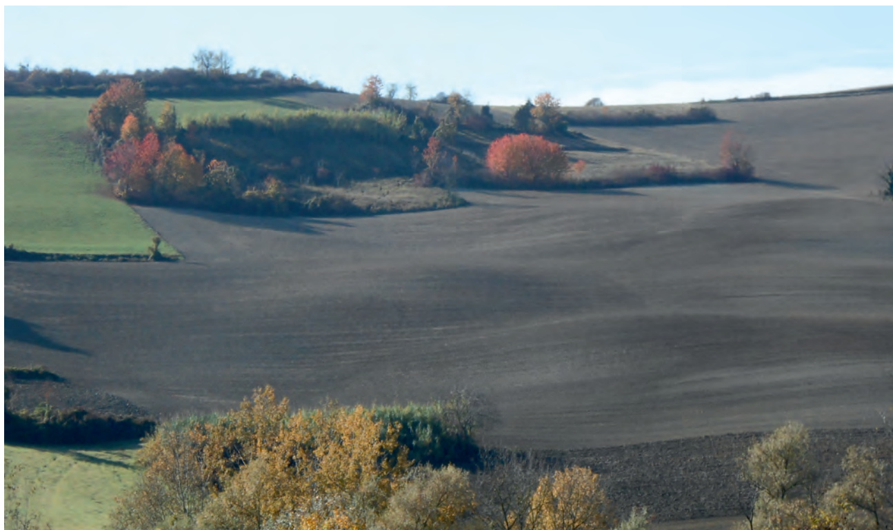
Fig. 3 - Dolina attribuite a subsidenza (Frazione Vastapaglia di Coconato, Asti). - Doline due to Subsidence (Frazione Vastapaglia di Coconato, Asti).