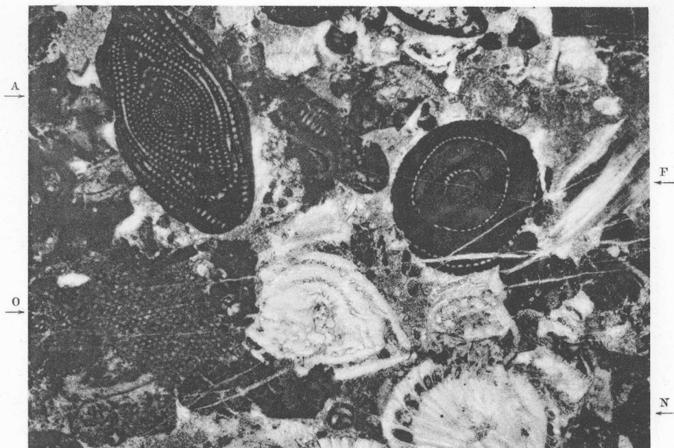
1. Eocene medio di M. Montarello (Prof. IV), nummuliti radiate (N), alveoline consumate ( A. schwaegeri CH. - RISP. (A), flosculine (F) e orbitoidi (O), 14 x.