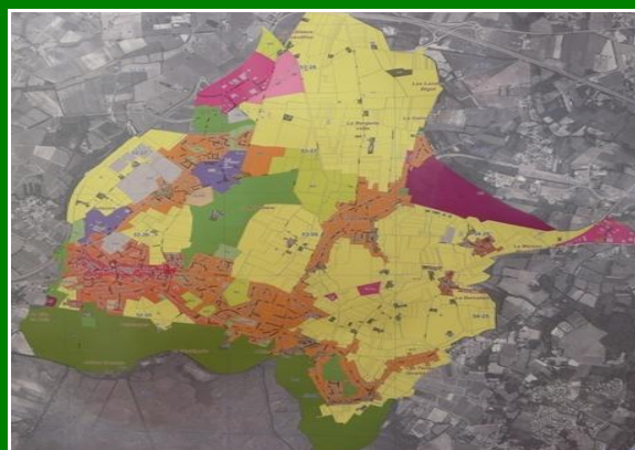
Figura 11.4.4 – Nantes Plan Local d'Urbanisme 2007