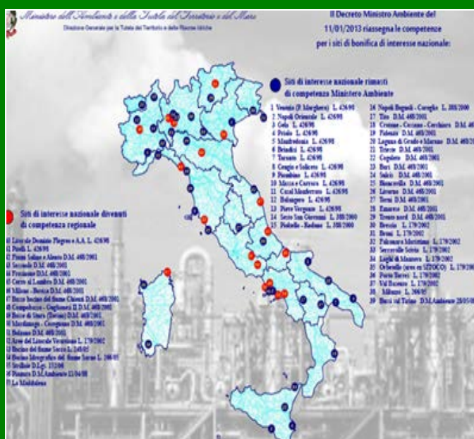
Figura 11.7.1 – Mappatura dei Siti di Interesse Nazionale