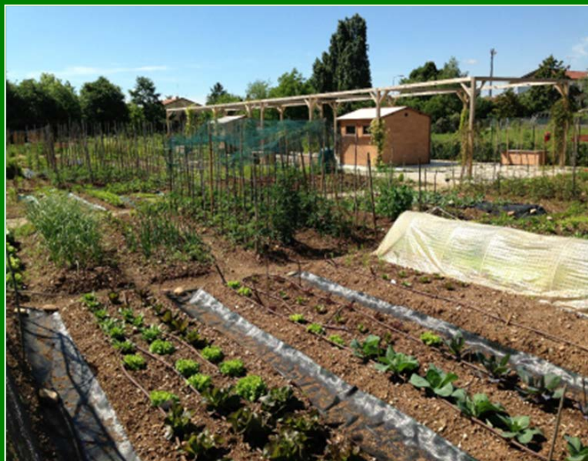
Figura 11.6.1 - Area orti urbani udinesi di via Zugliano