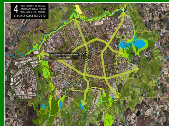
Figura 11.4.5 – Vitoria Gasteiz, Plan Urbanistico 2006