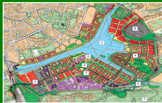
Figura 11.4.3 – Stoccolma, Urban Regeneration Hammarbyn Sjöstad Master Plan