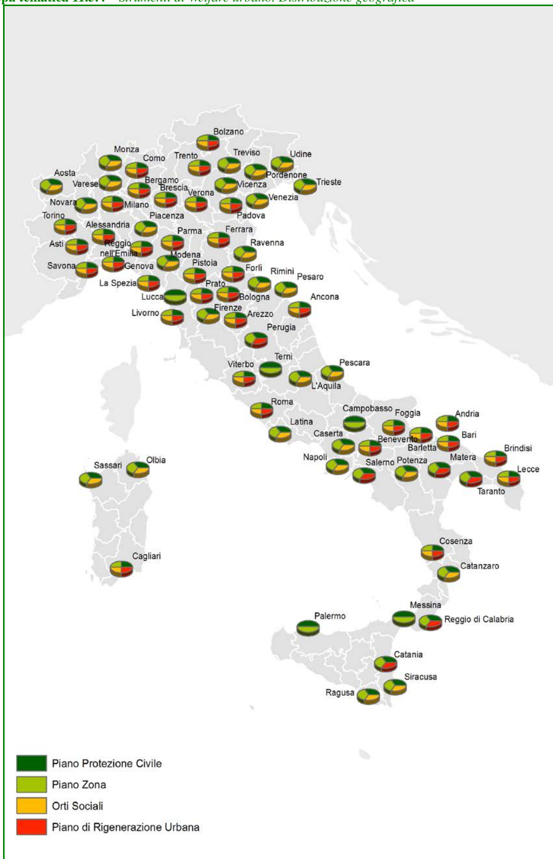
Mappa tematica 11.5.4 – Strumenti di Welfare urbano. Distribuzione geografica

La necessità di agire nei confronti di conflittualità antiche e nuove, sicurezza e disuguaglianze hanno reso preziose le esperienze maturate negli anni all'interno dello strumento dei Contratti di Quartiere, in grado di portare a soluzioni condivise e che la rigenerazione urbana fa proprie.