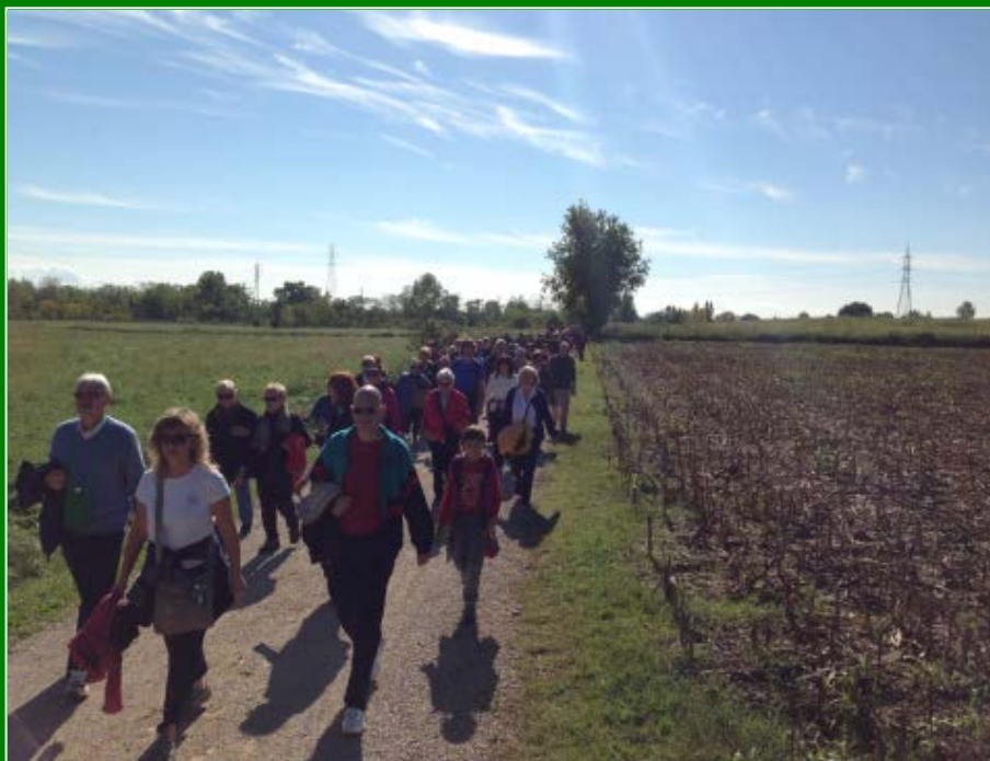
Figura 11.6.2 - Attività di progettazione partecipata - Parco del Torre

Ne beneficia l'intero sistema, che oggi si riscopre accomunato da una identità ed un paesaggio caratteristici, che ne rendono identificabili i tratti salienti e ne consentono di conseguenza una più precisa tutela e valorizzazione. Un risultato che costituisce un nuovo punto di partenza, per la definizione di ulteriori obiettivi, per un costante miglioramento della qualità della vita.