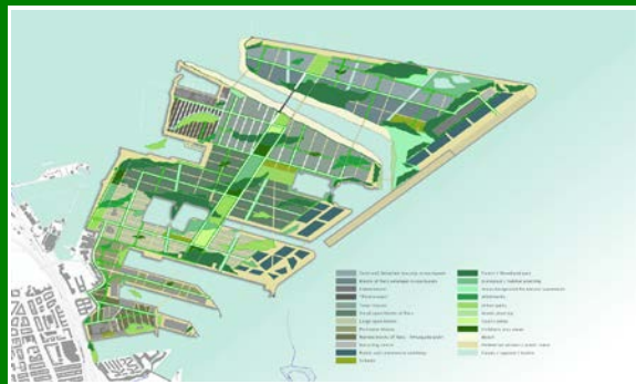
Figura 11.4.2 – Copenhagen, Urban Regeneration Nordhavn Structure Plan