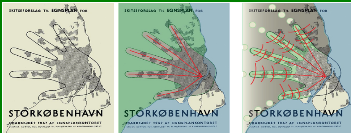
Figura 11.4.1: Copenhagen, Piano Urbanistico Five Finger Plan