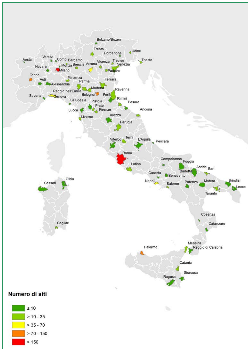
Figura 11.1.2 - Numero di siti registrati EMAS per area urbana