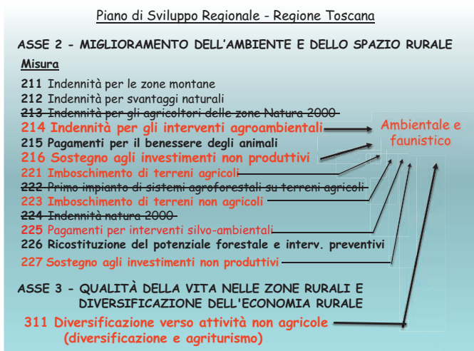
Figura 7.1 - Misure del PSR toscano previste negli ASSI 2 e 3.

tipici del paesaggio toscano caratterizzato dall'alternarsi di zone coltivate a zone boscate, collegate tra loro attraverso macchie e formazioni lineari, oltre che di ripristinare le sistemazioni del terreno aventi sia la funzione di modellamento dei versanti che di regimazione delle acque.”