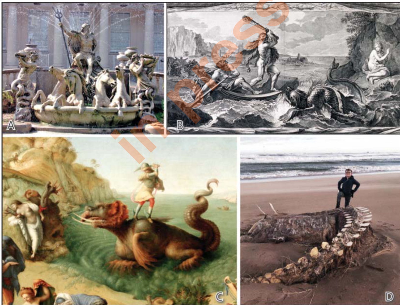
Fig. 1 - (A) Fontana di Nettuno, Cheltenham (UK). (B) Eracle salva Esione dal mostro marino Ceto, incisione anonima. (C) Piero di Cosimo, Liberazione di Andromeda (1510-1515). (D) Lo scheletro di cetaceo gettato a riva in Scozia nel Febbraio 2020 (Fubar News, https://www.facebook.com/FubarNews/ , accesso 12/02/2020). - (A) Fountain of Neptune, Cheltenham (UK) . (B) Heracles rescues Hesione from the sea monster Cetus, anonymous engraving . (C) Piero di Cosimo, Liberation of Andromeda (1510-1515) . (D) The cetacean skeleton thrown ashore in Scotland in February 2020 (Fubar News, https://www.facebook.com/FubarNews/, access 12/02/2020) .