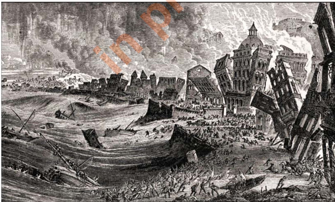
Fig. 4 - Terremoto e maremoto di Lisbona, 1755, incisione dell'epoca, anonima. - Lisbon, 1755, earthquake and tsunami, anonymous engraving of the time.

Immanuel Kant si appassionò molto all'evento, e raccolse moltissime informazioni per dimostrare che i terremoti sono fenomeni naturali e non una punizione divina. Nei suoi studi ipotizzò l'esistenza di caverne sotterranee riempite di gas caldi essere all'origine dei terremoti. Riportò anche numerose notizie di luci abbaglianti e cieli colorati prima del terremoto. Fra gli studi su questo terremoto fu di particolare importanza quello fatto dall'inglese John MICHELL (1761), eclettico professore di Cambridge, che fu il primo a introdurre l'idea che i terremoti viaggiassero per onde che si propagavano dall'ipocentro andando poi a sfumare con la distanza. Ritenne tuttavia che le scosse fossero prodotte da fuochi interni alla terra, simili a quelli che generavano i vulcani, che in contatto con l'acqua generavano