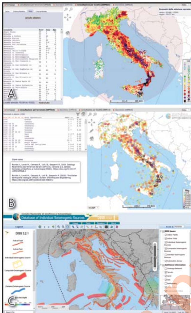
Fig. 6 - (A) DBMI15 (Database Macrosismico Italiano) e (B) CPTI15 (Catalogo Parametrico dei Terremoti Italiani) ( https://emidius.mi.ingv.it/CPTI15-DBMI15/ , ROVIDA et alii , 2019). (C) DISS (Database of Individual Seismogenic Sources) ( http://diss.rm.ingv.it/diss/ , DISS WORKING GROUP, 2018). - (A) DBMI15 (Italian Macroscopic Database) and (B) CPTI15 (Parametric Catalogue of Italian Earthquakes) ( https://emidius.mi.ingv.it/CPTI15-DBMI15/ ) (ROVIDA et alii , 2019). (C) DISS (Database of Individual Seismogenic Sources) ( http://diss.rm.ingv.it/diss/ , DISS WORKING GROUP, 2018).

stime dell'Intensità affidabili, come nelle aree scarsamente popolate o per i gradi più alti (dal X in poi), quando le costruzioni sono completamente distrutte e solo gli effetti sull'ambiente possono essere diagnostici. La Scala ESI2007 presenta 12 gradi ed è tarata sulle scale MM (Mercalli Modificata) e MSK (Medvedev-Sponheuer-Karnik). Nella figura che segue viene proposta la rappresentazione grafica della ESI2007