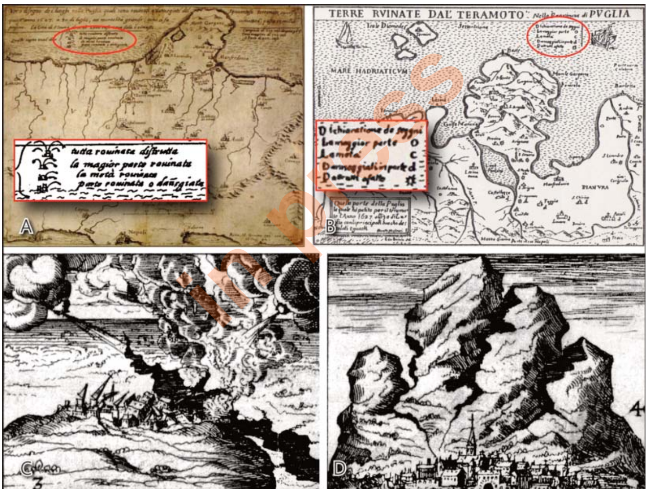
Fig. 3 - Le prime carte geografiche con classificazione dei danni sofferti dalle varie località, e relativa legenda (inset): (A) GREUTER (1627), (B) DE POARDI & MARINARI (1627). (C e D) Le prime rappresentazioni con localizzazione di voragini cosismiche nel terreno a Roseto (C) e Civitate (D) da DE POARDI (1627 b). - The first geographical maps with classification of the damages suffered by the various locations: and relative legend (inset): (A) GREUTER (1627); (B) DE POARDI & MARINARI (1627). (C e D) The first representations with the location of cosmic chasms in the ground in Roseto (C) and Civitate (D).

Il più forte evento sismico conosciuto in Italia. Due violentissime scosse avvenute a distanza di due giorni. La prima fu il 9 gennaio 1693, la seconda l'11 gennaio ed ebbe effetti veramente catastrofici, anche perché i danni andarono in parte a sovrapporsi a quelli della prima 11 . Le repliche, anche forti, furono avvertite per oltre 3 anni. Ci furono effetti d'intensità e dimensioni notevoli su un'area molto vasta. Tra