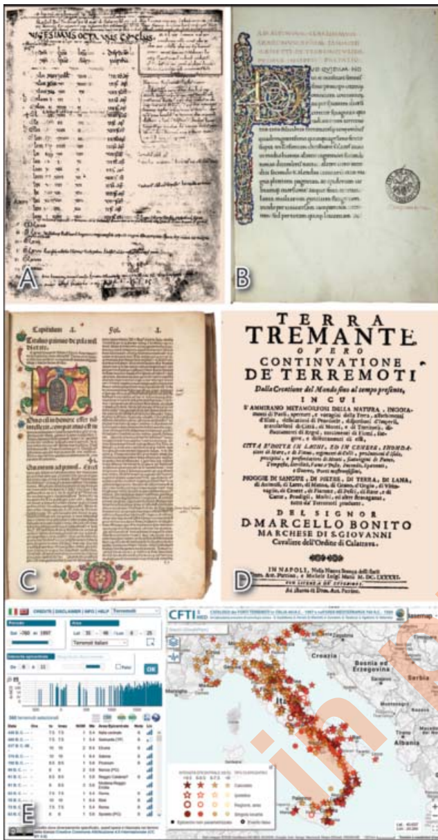
Fig. 2 - (A) Pagina dell' Annales Corbeiensis , manoscritto, con annotazione del terremoto (riquadro in alto a destra). (B) GIANNOZZO MANETTI, De terremotu , manoscritto, 1457. (C) S. ANTONINO DA FIRENZE, Chronicon , o Summa historialis , storia dalla creazione alla metà del XV sec., edizione del 1491, incunabolo. (D) M. BONITO, Terra tremante , Napoli, 1691, stampa. (E) CFTI5Med, Catalogo dei Forti Terremoti in Italia e nell'area Mediterranea , sito web interattivo (GUIDOBONI et alii, 2018, 2019; http://storing.ingv.it/cfti/cfti5/ ). - (A) Page of the Annales Corbeiensis , manuscript, with annotation of the earthquake (box at the top right). (B) GIANNOZZO MANETTI, De terremotu , manuscript, 1457. (C) S. ANTONINO DA FIRENZE, Chronicon , o Summa historialis , history from creation to the mid-fifteenth century, edition 1491, incunabulum. (D) M. BONITO, Terra tremante , Napoli, 1691, printed. (E) CFTI5Med, the new release of the catalogue of strong earthquakes in Italy and in the Mediterranean area, interactive website (GUIDOBONI et alii, 2018, 2019; http://storing.ingv.it/cfti/cfti5/ ).

pubblica di Venezia che allora controllava l'isola. L'epicentro è incerto ma si pensa che sia avvenuto tra l'est di Creta e l'isola di Rodi. Il terremoto innescò uno tsunami con onde alte sino a 9 metri, causando la morte di oltre 4.000 persone a Creta e investendo la costa di Alessandria, dove ebbe un run-up massimo di 9 metri.